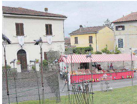
I PREMIATI DELLA KERMESSA DI PRIMAVERA