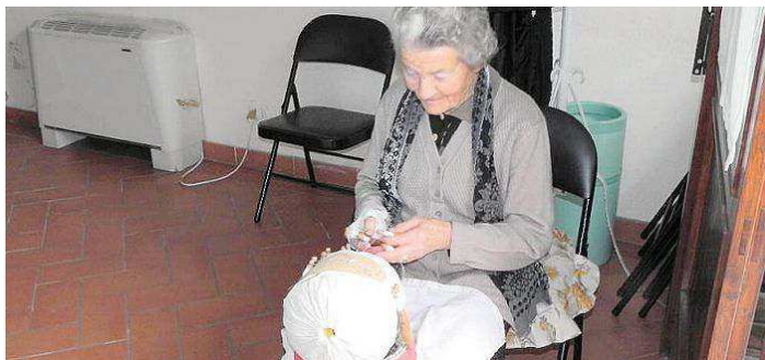
In alto gli uccelli in gara e un momento della premiazione, qui sotto un'artigiana del tombolo